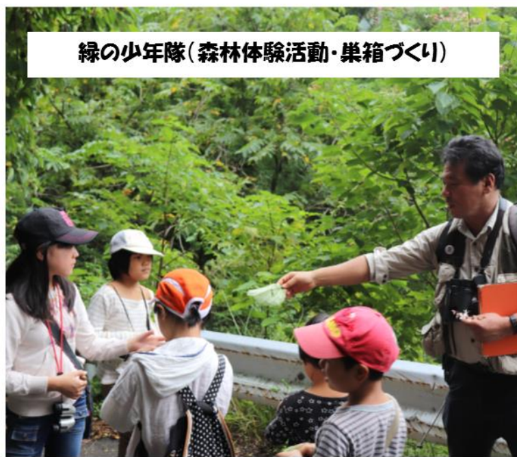
緑の少年隊(森林体験活動・巣箱づくり)