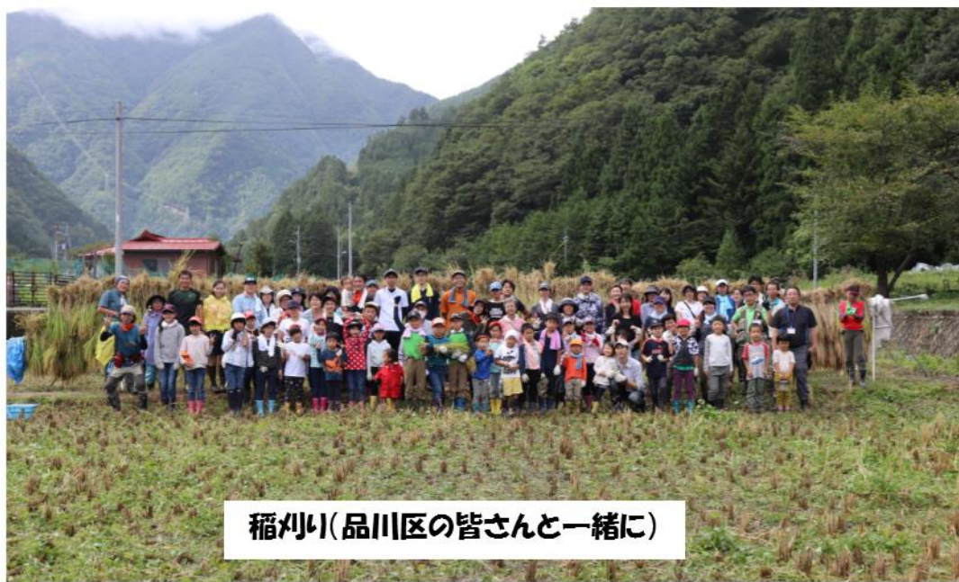
稲刈り(品川区の皆さんと一緒に)