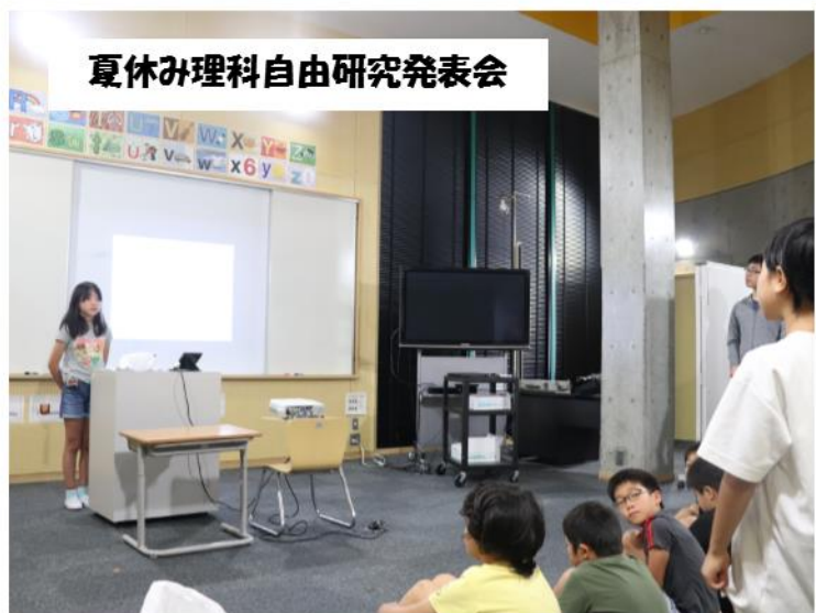
夏休み理科自由研究発表会