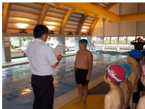
プール終い・水泳記録会